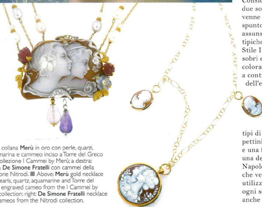
In alto: collana Merù in oro con perle, quarzi, acquamarina e cammeo inciso a Torre del Greco della collezione I Cammei by Merù; a destra: collana De Simone Fratelli con cammei della collezione Nitrodi. ■ Above: Merù gold necklace with pearls, quartz, aquamarine and Torre del Greco engraved cameo from the I Cammei by Merù collection; right: De Simone Fratelli necklace with cameos from the Nitrodi collection.

Napoleone e Giuseppina sono sicuramente tra i più noti protagonisti del Neoclassicismo. Durante il loro Impero, grazie alle campagne in Italia e in Egitto, l'arte e la cultura del periodo romano vennero riportate in auge. Considerato l'amore per il lusso, due sovrani, notevole importanza venne data ai gioielli che, prendendo spunto dalle linee classiche, assunsero particolari caratteristiche tipiche di quello che verrà definito Stile Impero. Gli ornamenti erano sobri ed eleganti e, grazie a gemme colorate e diamanti, spiccavano a contrasto con gli abiti chiari dell'epoca. Simbolo dell'oreficeria del tempo fu sicuramente la parure, che comprendeva di solito una collana, un paio di bracciali, orecchini pendenti, una fibbia e quattro tipi di ornamenti per capelli: un pettinino, una tiara, un diadema e una fascia. Sempre in seguito a una delle sue campagne in Italia Napoleone si innamorò dei cammei che vennero immediatamente utilizzati per la realizzazione di ogni sorta di ornamento, a volte anche incorniciati da diamanti o