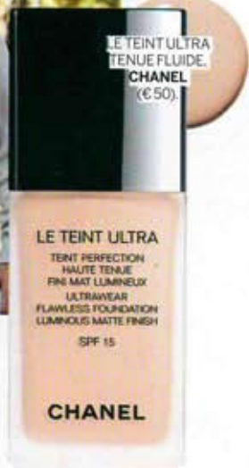
LE TEINT ULTRA TENUE FLUIDE. CHANEL (€ 50).

LE TEINT ULTRA TENT PERFECTION HAUTE TENUE FINE MAT LUMINEUX ULTRAWEAR FLAWLESS FOUNDATION LUMINOUS MATTE FINISH SPF 15 CHANEL