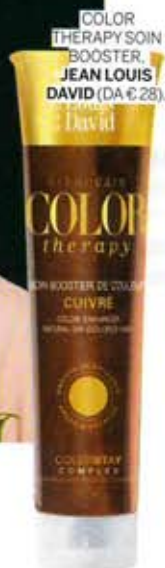
COLOR THERAPY SOIN BOOSTER. JEAN LOUIS DAVID (DA € 28).