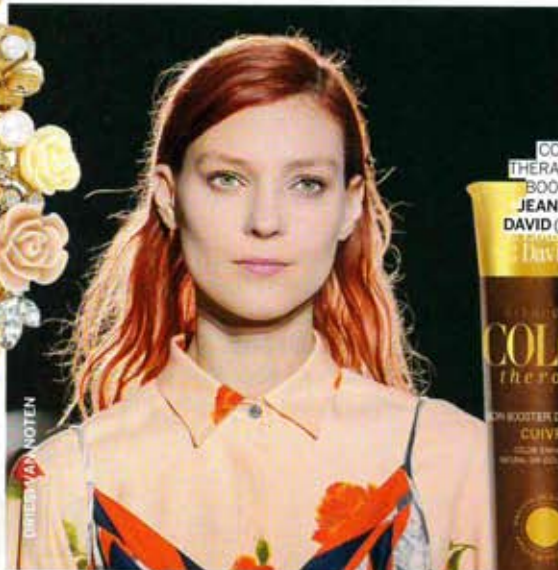
DIRETTORE FASHION NOTES