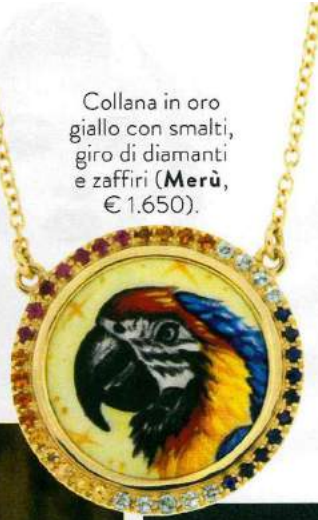
Collana in oro giallo con smalti, giro di diamanti e zaffiri (Merù, € 1.650).