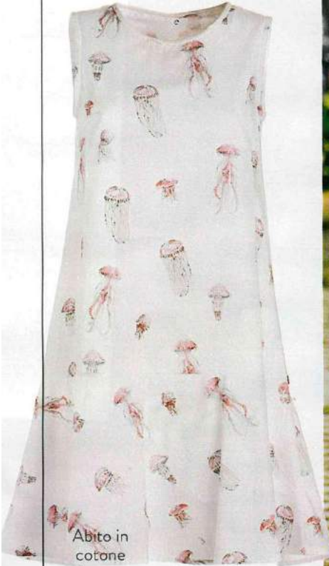
Abito in cotone stampa meduse (otto d'Ame, € 155).