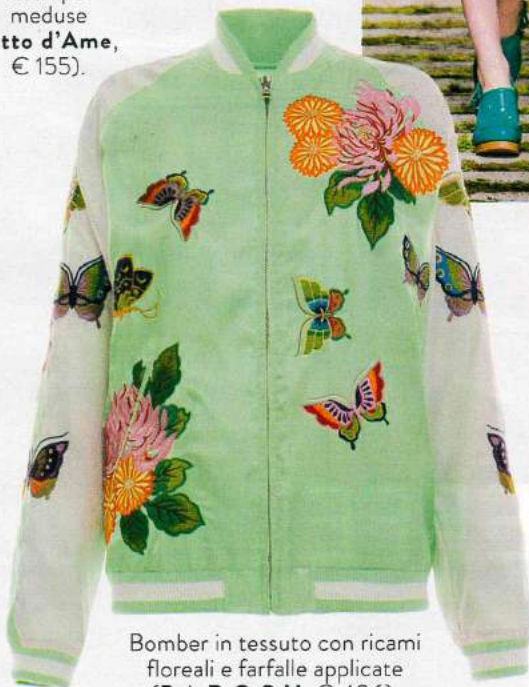
Bomber in tessuto con ricami floreali e farfalle applicate (P.A.R.O.S.H., € 406).