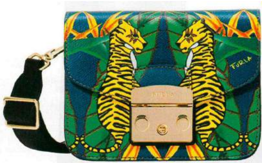
Si chiama Metropolis la borsa in pelle con le tigri (Furla, € 295).