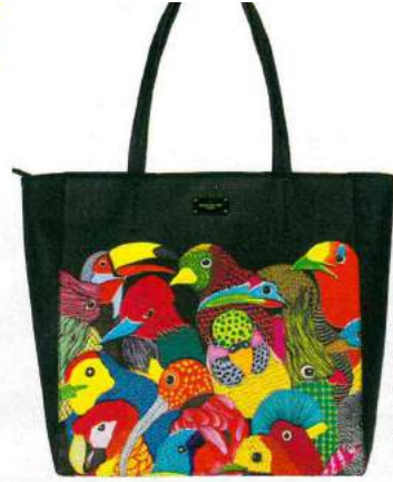
Shopping in saffiano stampato (Paul's Boutique, € 129).